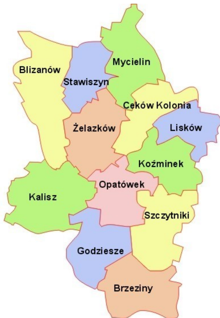
Rysunek 1 Położenie poszczególnych gmin powiatu kaliskiego.