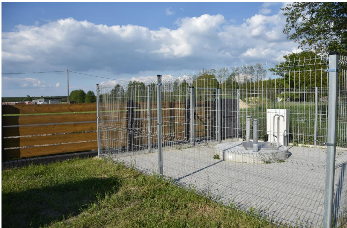
zdjęcie nr 2