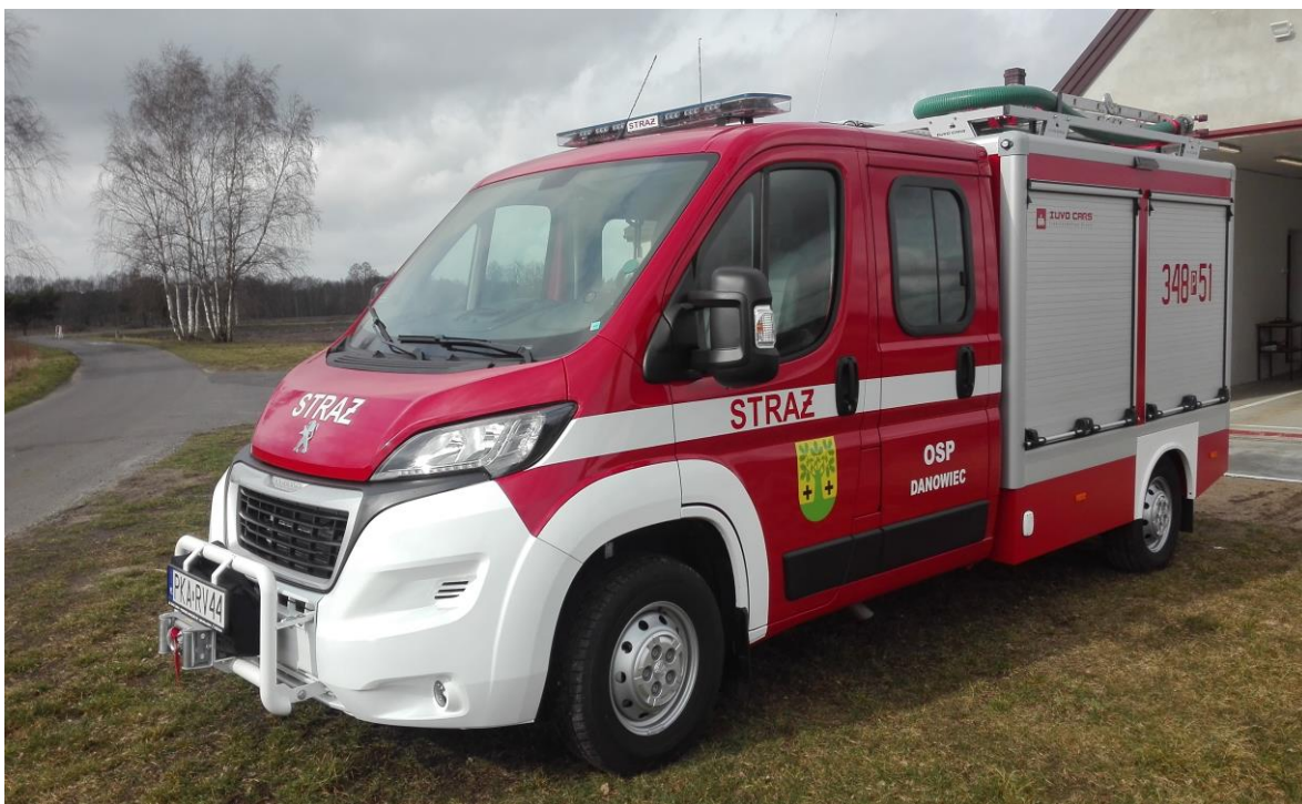
zdjęcie nr 1