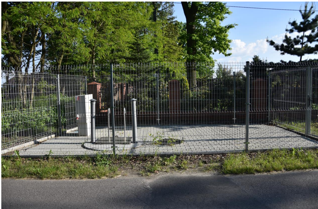
zdjęcie nr 2