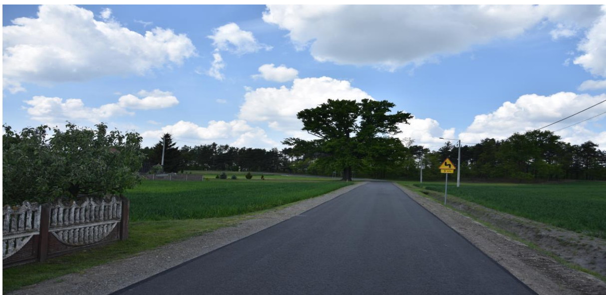
zdjęcie nr 1