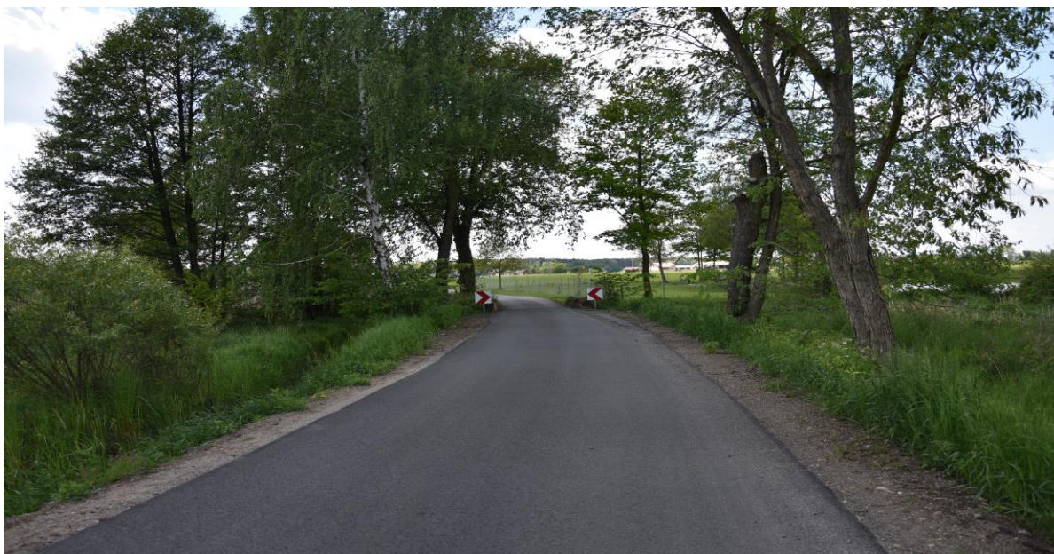
zdjęcie nr 3