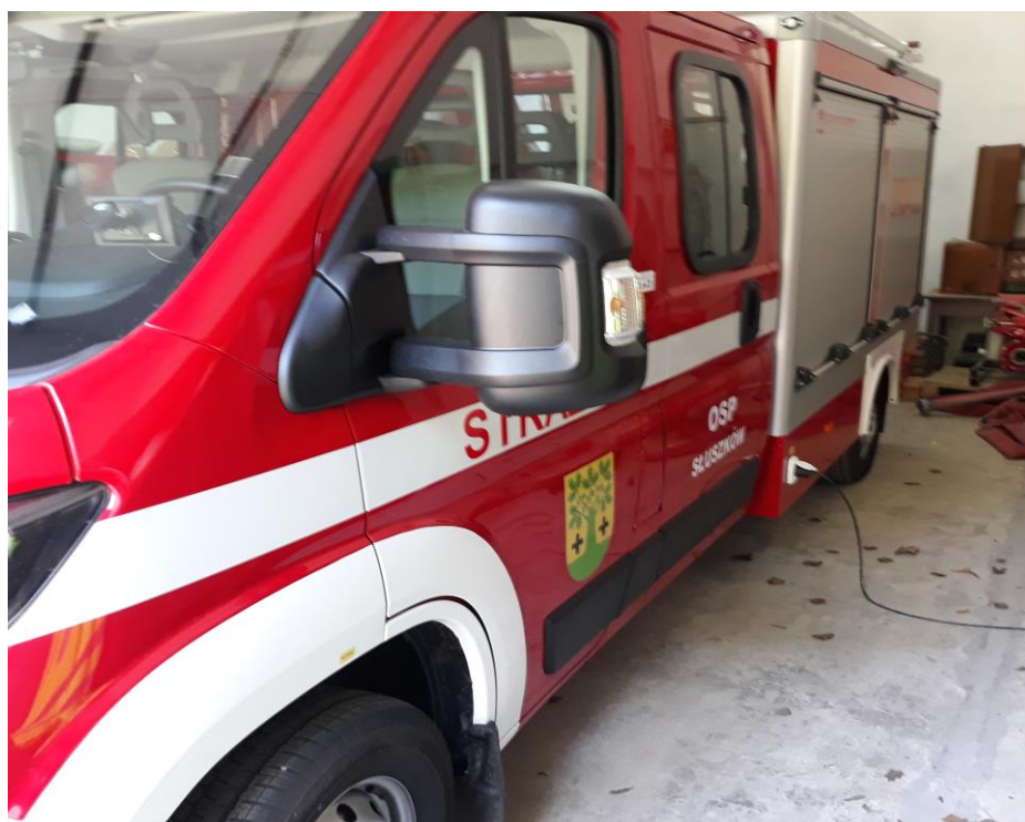
zdjęcie nr 2