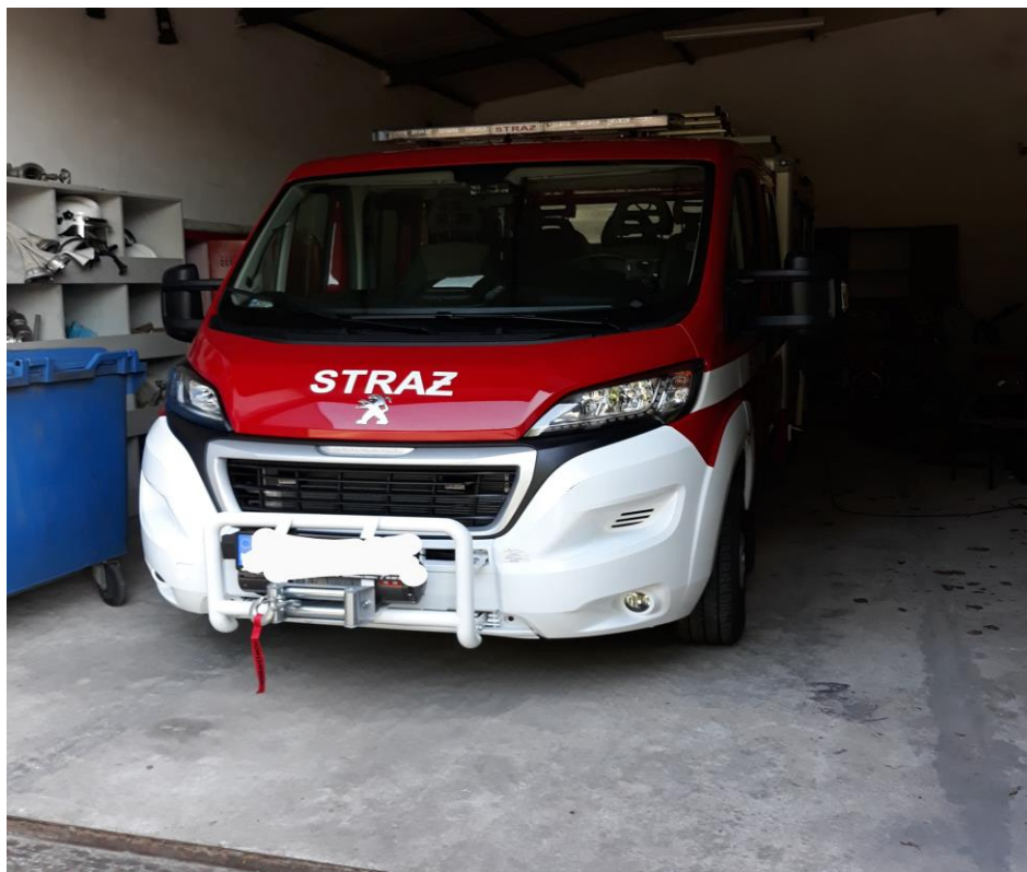
zdjęcie nr 1