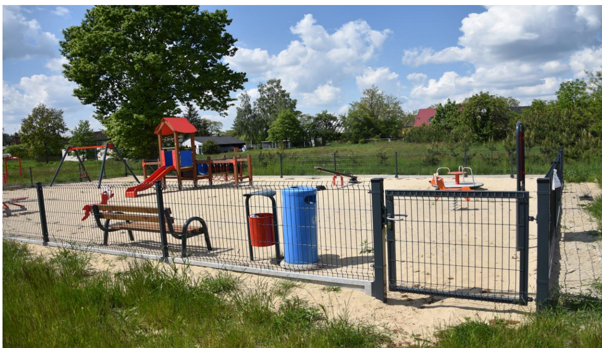
zdjęcie nr 2