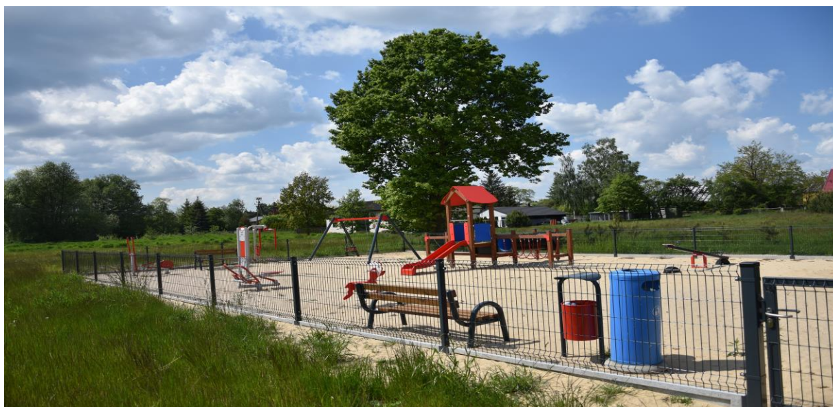
zdjęcie nr 3