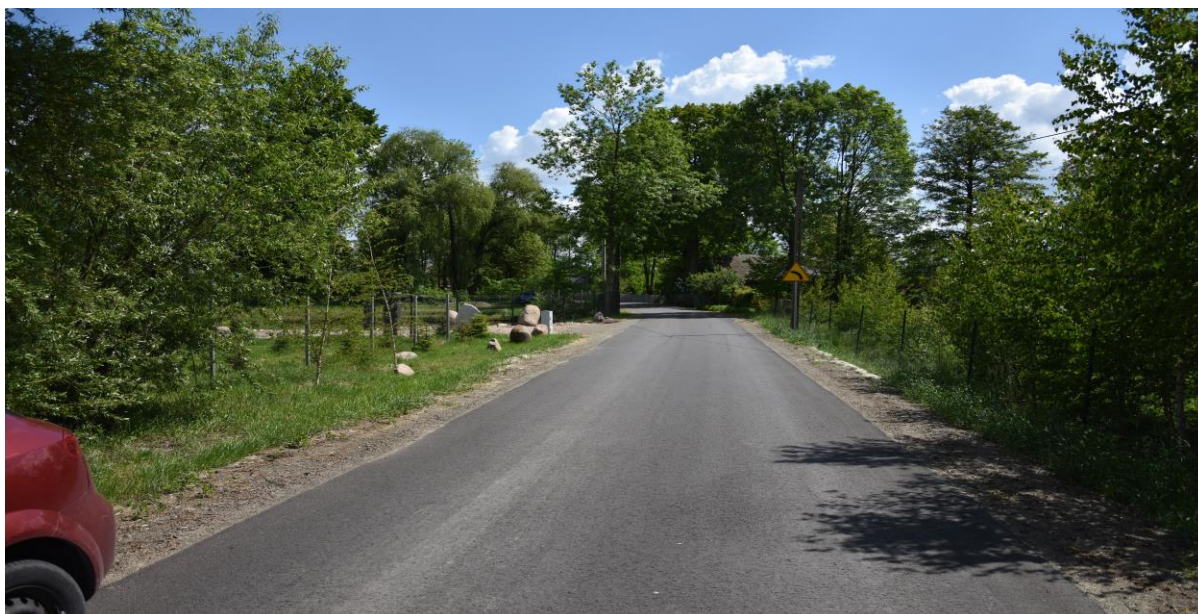
zdjęcie nr 2