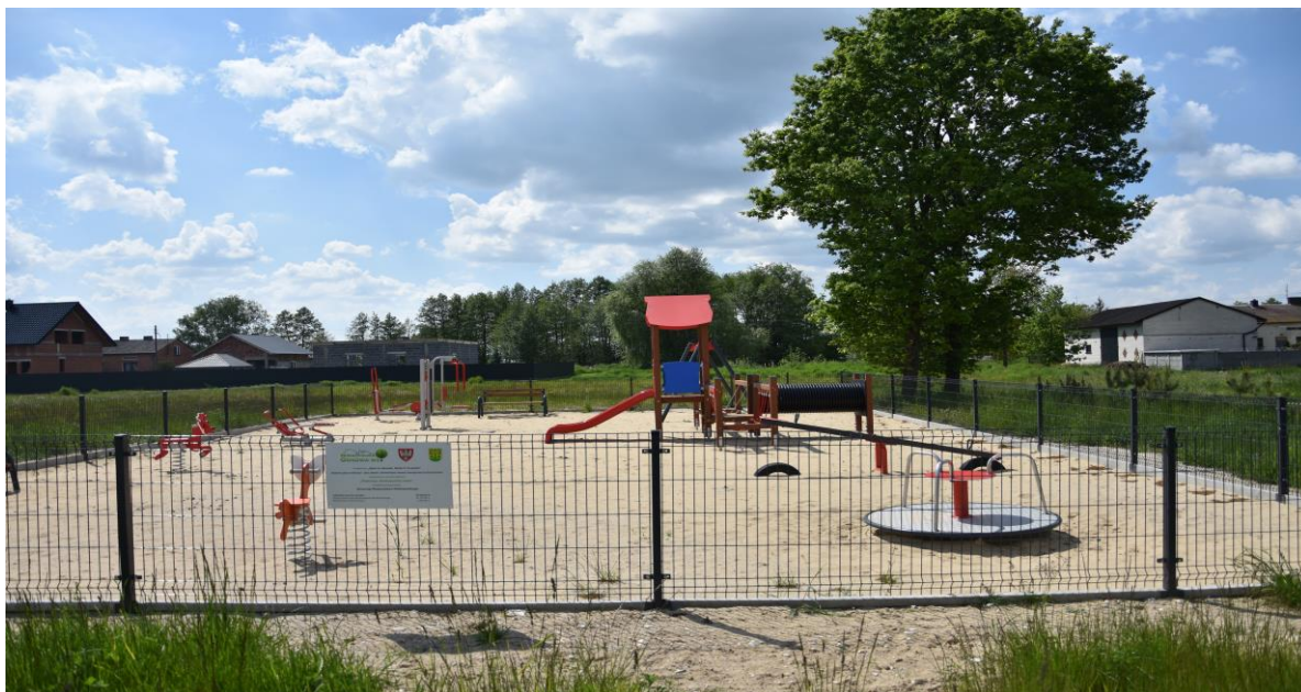
zdjęcie nr 1