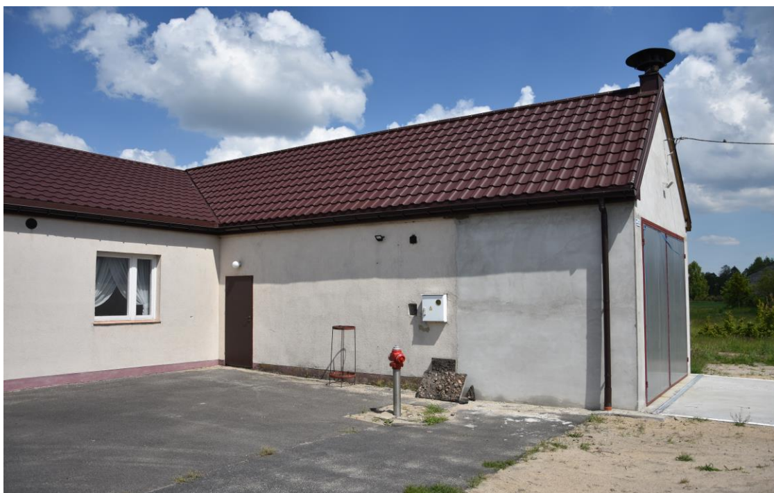
zdjęcie nr 2