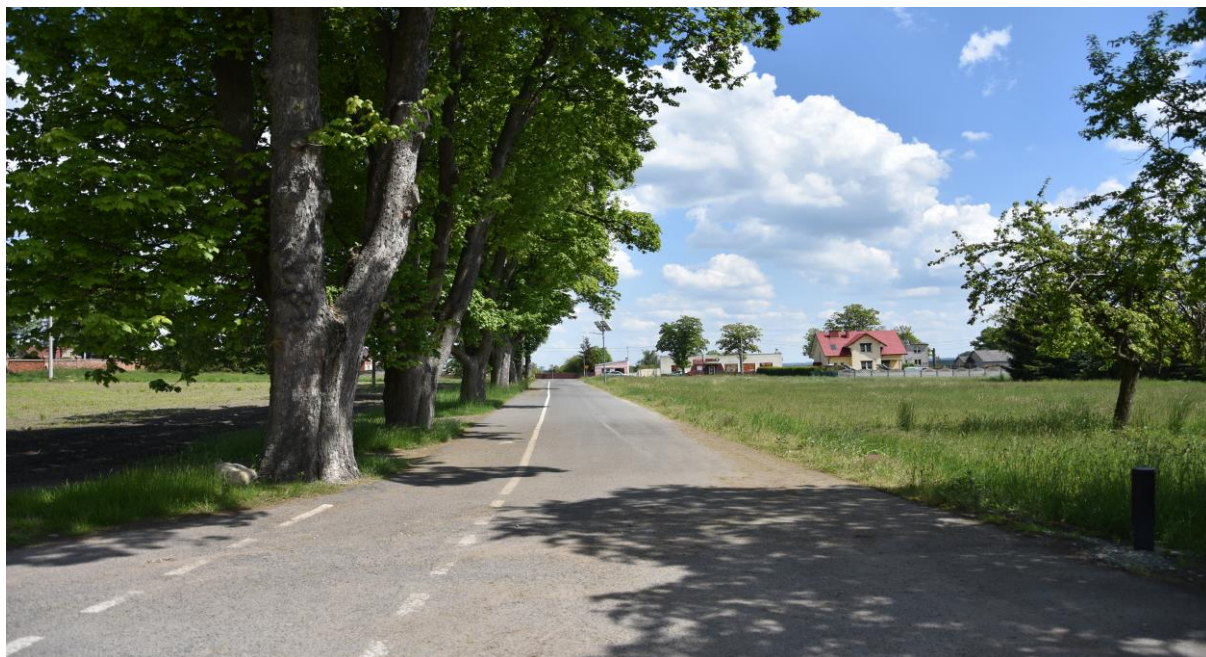
zdjęcie nr 2