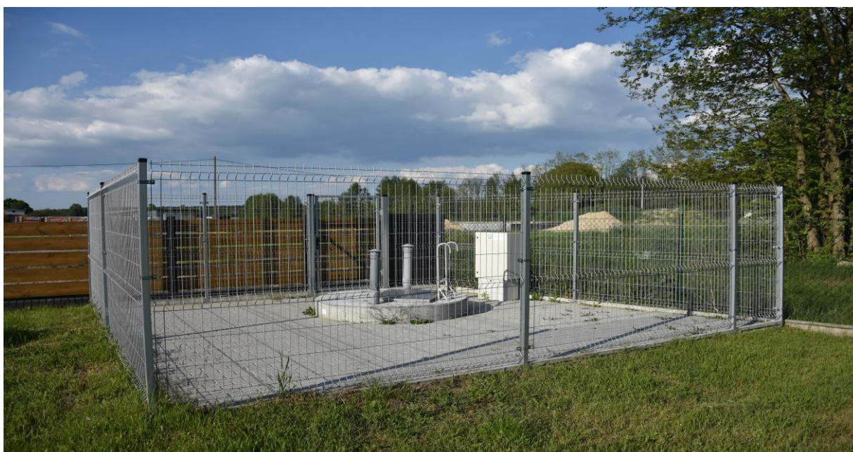
zdjęcie nr 1