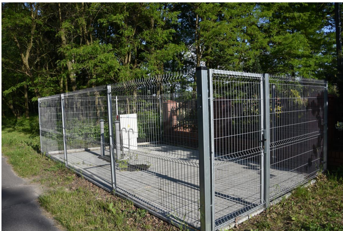
zdjęcie nr 1