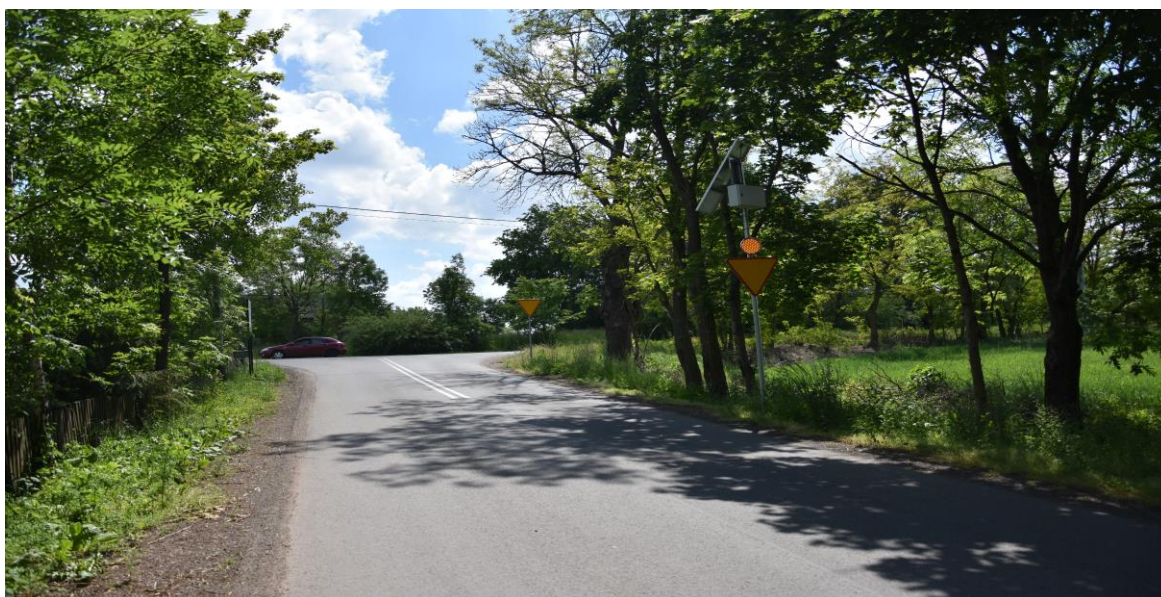
zdjęcie nr 2