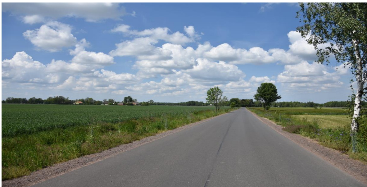
zdjęcie nr 3