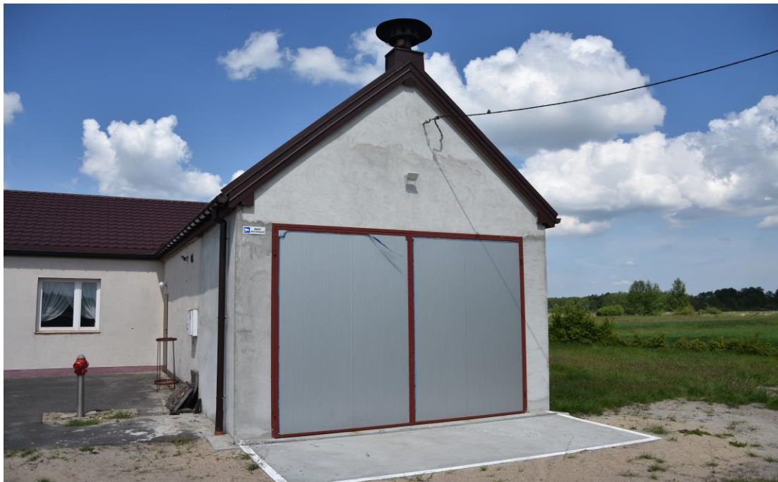
zdjęcie nr 1