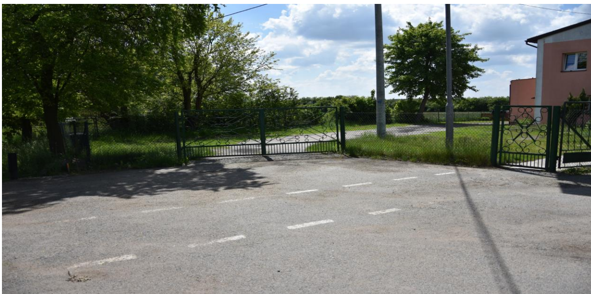
zdjęcie nr 3

Zgodnie ze Strategią Rozwoju Gminy Mycielin na lata 2014 – 2020 zostały w 2019r. osiągnięte następujące cele: