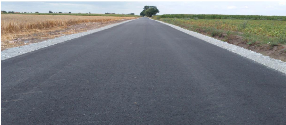
zdjęcie nr 1