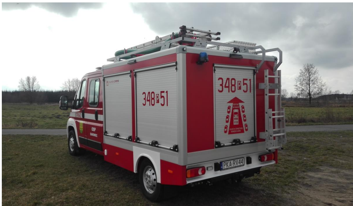
zdjęcie nr 2