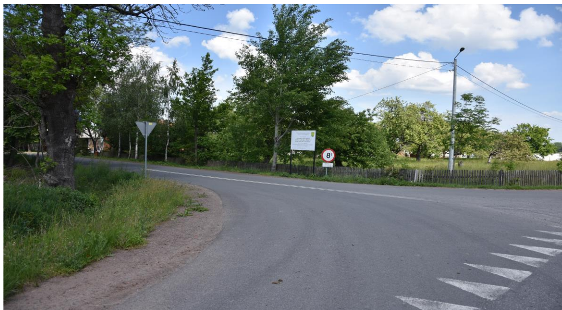
zdjęcie nr 1