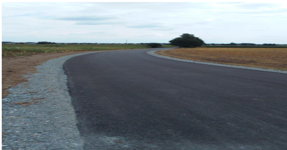
zdjęcie nr 3