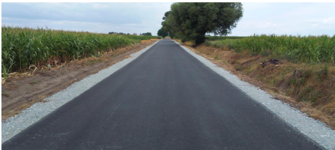
zdjęcie nr 2