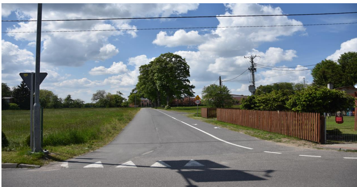
zdjęcie nr 1